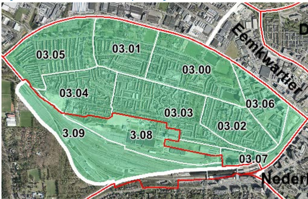
Figuur 1 Soesterkwartier en spoorwegzone: nieuwe situatie

Opmerking: rood geeft de oude wijkgrens aan, de dikke witte lijn (het groene gebied) de nieuwe wijkgrens van Soesterkwartier en de dunne witte lijnen de voorgestelde buurtgrenzen.