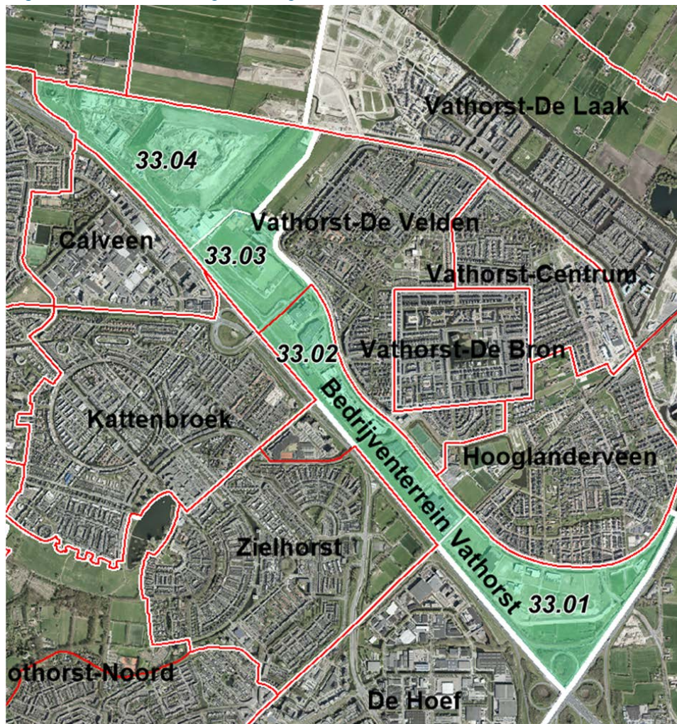
Figuur 3 Nieuwe wijk Bedrijventerrein Vathorst

Opmerking: rood geeft de oude wijkgrens aan, de dikke witte lijn de nieuwe wijkgrens en de dunne witte lijnen de voorgestelde buurtgrenzen.